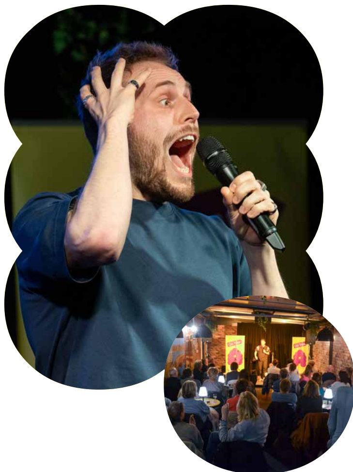
Comedy night in Café 't Centrum en t Manneke

Binnen deze programmering zoeken we een balans tussen gevestigde namen en nieuwe makers. Tegelijk bieden we nadrukkelijk ruimte voor experiment en nieuwe presentatievormen, waarin disciplines elkaar ontmoeten en grenzen vervagen. Er is specifieke aandacht voor jonge makers en nieuwe stemmen, bijvoorbeeld via initiatieven zoals een jongerenfestival, cross-over formats, talentontwikkelingstrajecten en samenwerkingen met spoken word-platforms.