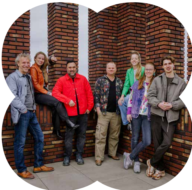
Het team van Casa Cadanza

Bij Casa Cadanza onderzoeken we of we vrijwilligers inzetten voor onder andere, gastvrouw, assistent horeca, technische assistent. We houden bij over welke vaardigheden onze vrijwilligers beschikken en welke wensen zij hebben rond bepaalde rollen. Zo kunnen we vrijwilligers, wanneer daar vanuit Casa Cadanza vraag naar is en in overleg met de vrijwilliger, op een specifieke rol of taak inzetten.