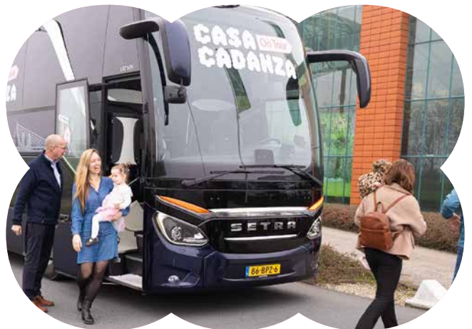
De 'tourbus' Casa Cadanza on tour

Jeugdtheaterschool Hofplein brengt een deel van haar lessen onder in Casa Cadanza. Dat geeft de leerlingen de kans zich te ontwikkelen in een professionele theateromgeving.