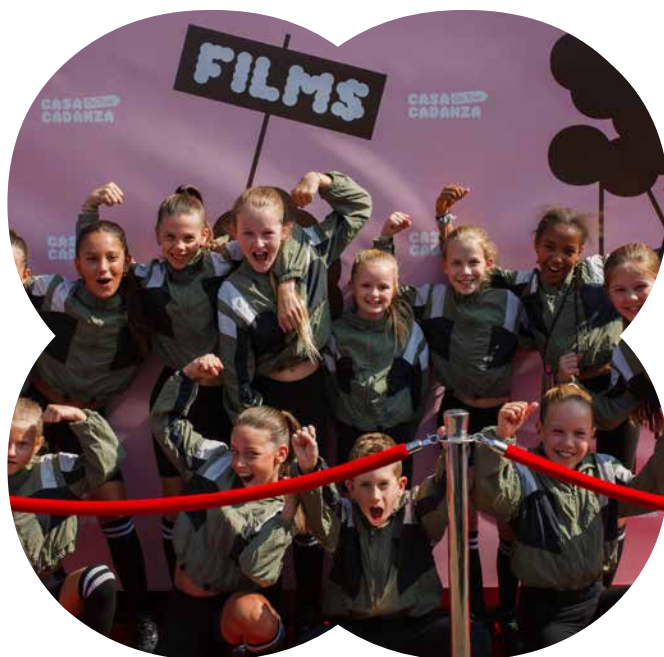
Open cultuurdag, 2025